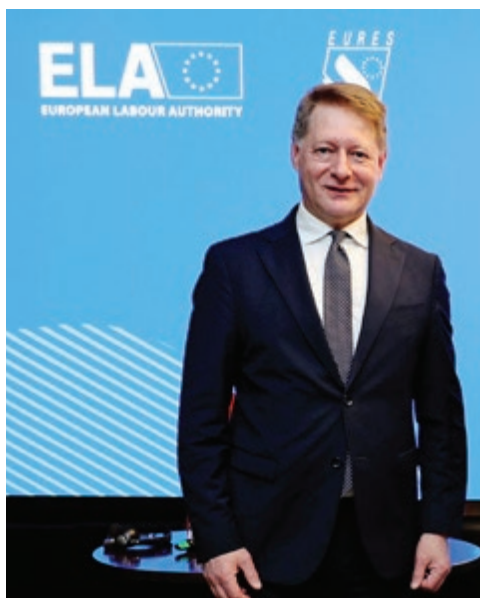
Cosmin Boiangiu, director executiv European Labour Authority

În timp ce pentru muncitorii calificați se poate vorbi despre un deficit persistent de forță de muncă în construcțiile din întreaga Europă și despre dificultăți constante de recrutare, în cazul ocupațiilor cu cerințe reduse de calificare se observă, dimpotrivă, existența unui surplus de personal.