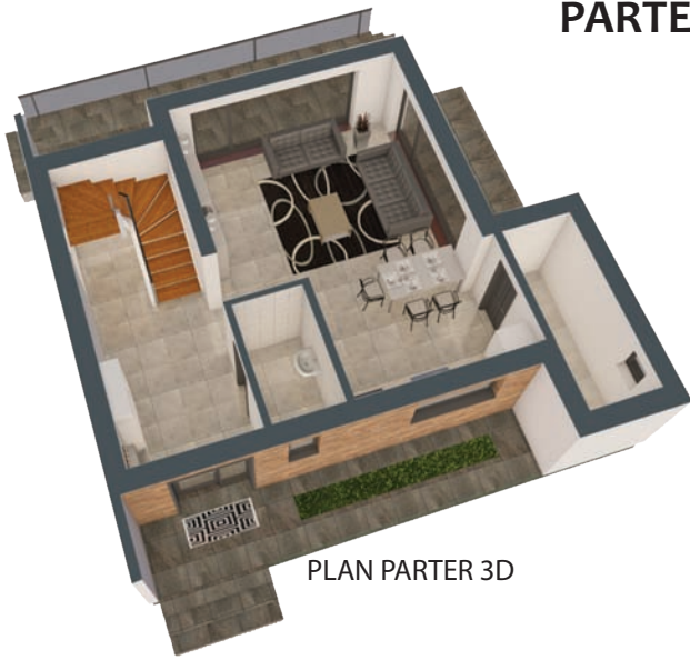
PLAN PARTER 3D