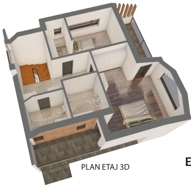
PLAN ETAJ 3D