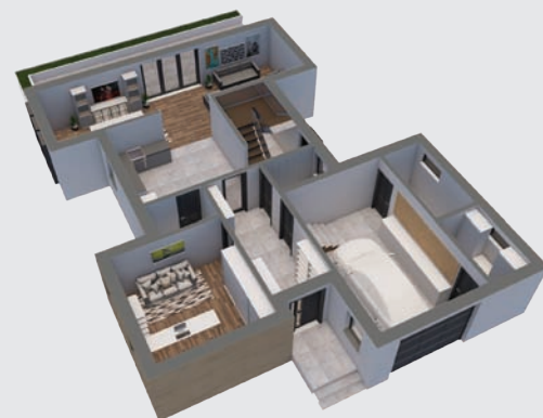
PLAN PARTER 3D