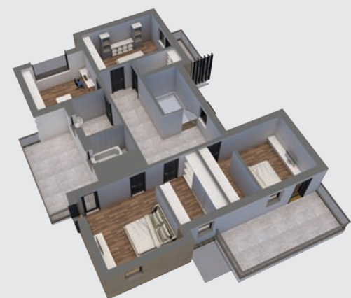
PLAN ETAJ 3D